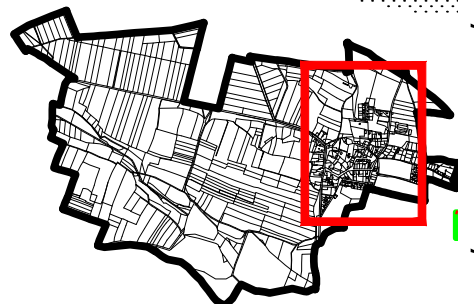
SCHEMA 1 : 50 000